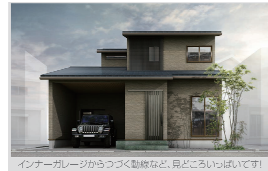
インナーガレージからつづく動線など、見どころいっぱい！

お施主様のご厚意により、1日限りの完成見学会を開催させていただきます。今回ご覧いただけるのは、延床約30坪の木造2階建て住宅です。趣味と過ごしやすさを両立した間取りで、アウトドアのご趣味をいっぱい楽しんで帰ってきても安心のお住まいです。また、シックな色合いの内装デザインもぜひご参考ください。