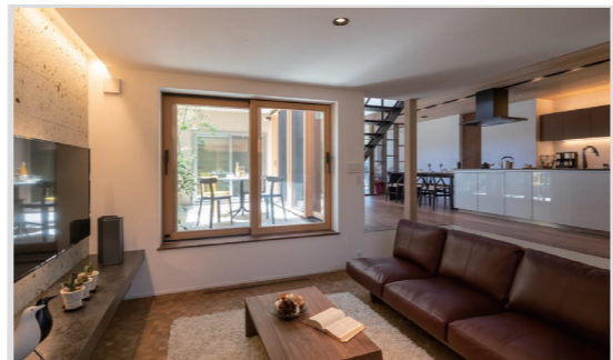
キッチンからリビング・ダイニングへのつながりは、必見です！

「伝統的な京町家の豊かな暮らし」と「快適性や利便性を求めた現代のライフスタイル」をコンセプトにした、弊社の北野展示場にてインスタライブを開催いたします。営業担当がモデルハウスのポイントをLIVEでお届けします。配信後、プレゼント企画もございます。ライブ中は質問も大歓迎です。お気軽にご参加ください。