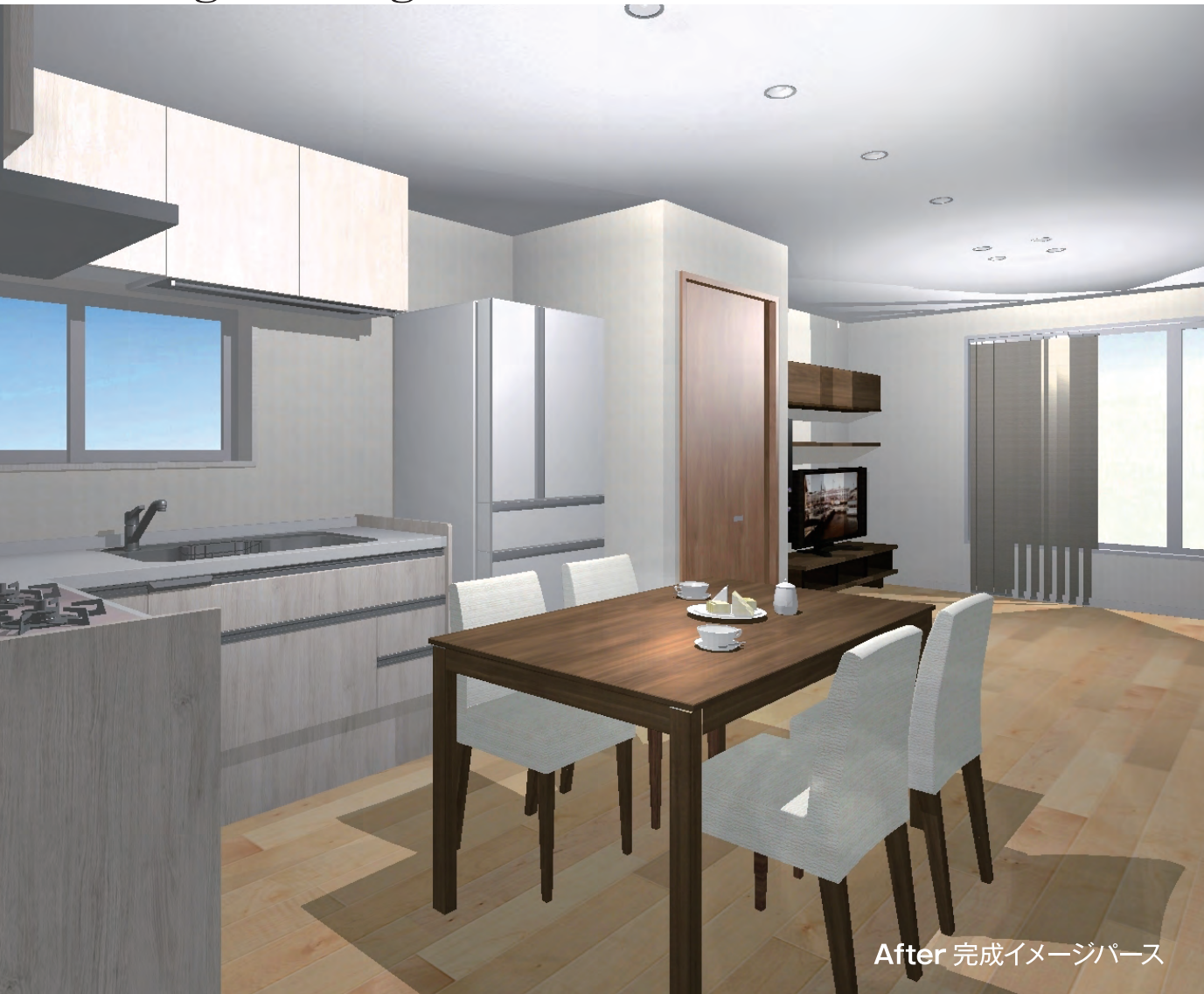
After 完成イメージパース